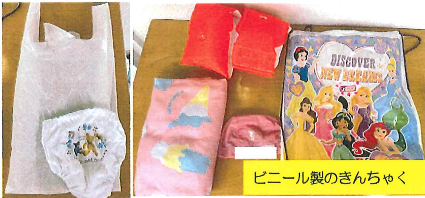
ビニール製のきんちゃく