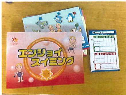
お家で保管をお願いします。