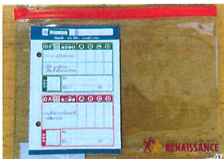
泳力認定日の日に持たせてください。

スイミングノートとテストカードはお家で保管して下さい。テストカードは泳力認定日のレッスンの日(後日お伝えします)に下記のような透明なファイルにテストカードを入れて持たせてください。